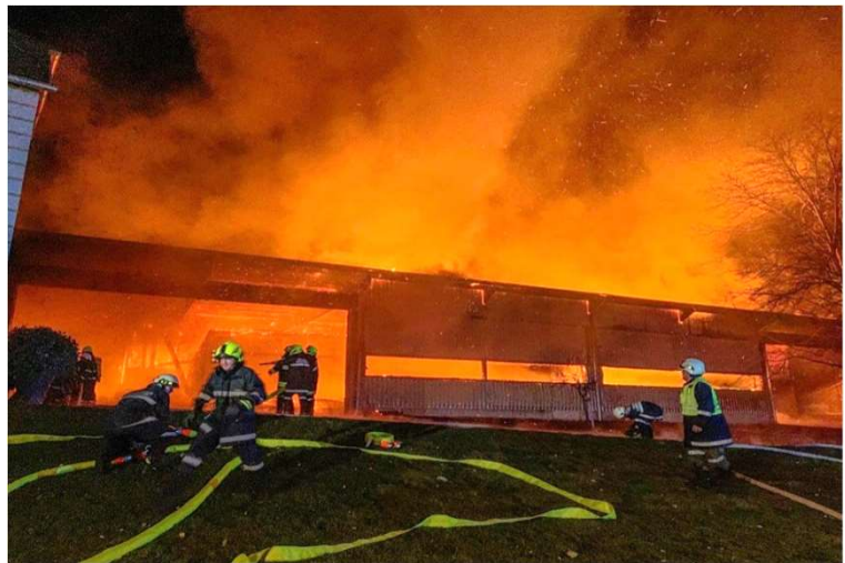
18.11.2019 Vollbrand d. Wirtschaftsgebäudes in Eigendorf. Ein Übergreifen auf das Wohnhaus wurde durch die Feuerwehr Prinzersdorf verhindert.

Im Jahr 2019 rückte unsere Feuerwehr 33-mal (Stand 11.12.2019) aus, und leistete in Summe ca. 820 Stunden an freiwilliger Arbeit. Die Vielfalt unserer Einsätze reichte von technischen Hilfeleistungen wie Menschenrettung bei Verkehrsunfällen, PKW-Bergungen, Brandsicherheitswachen, Wespennest-entfernen, Sturm-Einsätzen und Vermurungen nach Unwettern bis zu einigen Brandeinsätzen wie zum Beispiel: Bahnstrasse, GH Dangl und Brand einer Hackschnitzelanlage in Eigendorf.