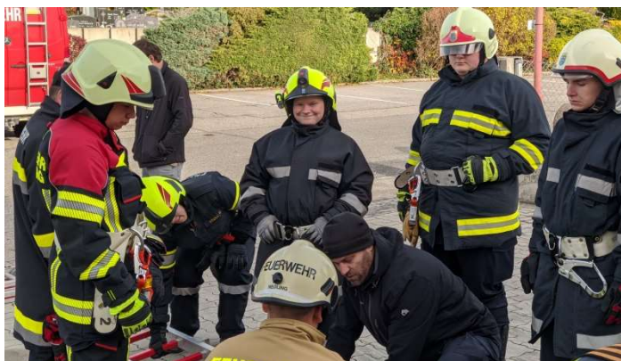
Die Vorbereitung bei der Feuerwehr Hafnerbach.

Schwerpunkte des Übungsprogrammes im ersten Halbjahr war der Test für die Tauglichkeit beim Atemschutzeinsatz (Bild: Finnen-Test)